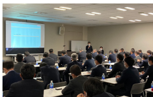
P.045 「GHG排出量可視化プロジェクト」 中長期方針説明会

当社は、資材品質の安定化と、調達における方針やガイドライン浸透を目的に、2002年からサプライヤーを対象とした品質方針説明会を定期的開催してきました。COVID-19の影響により2020年からは開催を見送っていましたが、2022年10月に当社の進むべき方向性を共有する「中長期方針説明会」へと変更して開催しました。説明会には、オンラインを含めて69社234名が参加し、調達における人権・労働・環境問題や品質の安定性に対する取り組み姿勢を示した「調達基本方針」「ユニ・チャームグループ サステナブル調達ガイドライン」や、「ユニ・チャームグループ人権方針」の浸透を図るとともに、「Kyo-sei Life Vision 2030」「環境目標2030」の達成に向けた「GHG排出量可視化プロジェクト」やSedexへの連携強化を要請しました。